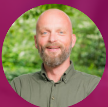
Derk Jan Poel Diaconaat & Communicatie