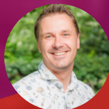
Arjen Uil Jeugd & Geloofsopvoeding