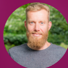
Anko Oussoren Jeugd