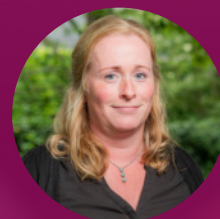
Christien de Ruyter Pastoraat & Jeugd