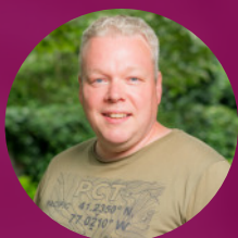
Jenne Minnema Jeugd