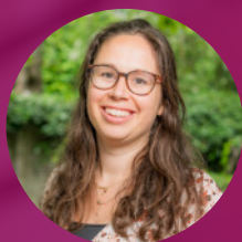
Marjolijn Matei Jeugd & Leren in de kerk